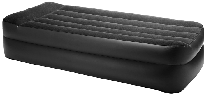
het opgeblazen luchtbed

Lotte heeft een luchtbed. Ze pompt het bed op met een ingebouwde elektrische pomp die ze aansluit op de netspanning.