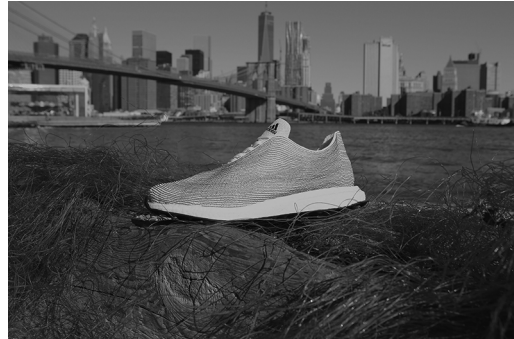
schoen gemaakt uit plasticsoep